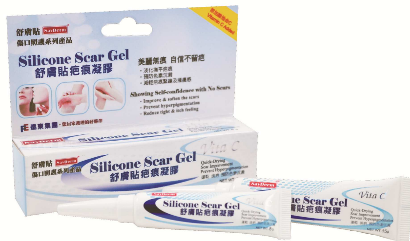
图一、疤痕凝胶 - 美白疤痕凝胶

疤痕凝胶之所以能有效淡化疤痕组织，主要是藉由硅凝胶对疤痕的软化保湿水合功效，使疤痕可透过正常的胶原合成周期，促使疤痕变得平坦且柔软，且亦能降低疤痕所造成的搔痒及色泽改变等问题（图二）。除了硅胶本身对疤痕的抚平淡化功效之外，在配方内额外添加了酯化维他命 C，让疤痕淡化的过程中，同时可预防黑色素沉淀，更快达到淡化疤痕的功效。