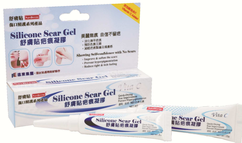
圖一、疤痕凝膠 - 美白疤痕凝膠

疤痕凝膠之所以能有效淡化疤痕組織，主要是藉由矽凝膠對疤痕的軟化保濕水合功效，使疤痕可透過正常的膠原合成週期，促使疤痕變得平坦且柔軟，且亦能降低疤痕所造成的搔癢及色澤改變等問題(圖二)。除了矽膠本身對疤痕的撫平淡化功效之外，在配方內額外添加了酯化維他命 C，讓疤痕淡化的過程中，同時可預防黑色素沉澱，更快達到淡化疤痕的功效。