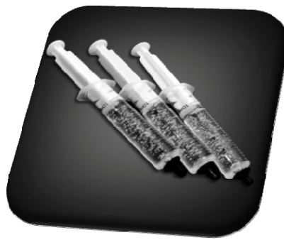
图一、牙齿美白凝胶

随着经济富裕，国人对于外表美观的要求日益提升，对于牙齿外观的洁白也越来越重视。牙齿变色的主要原因包括不良的口腔卫生、食用含有色素的食物和饮料以及抽烟等。远东开发的美白凝胶产品(图一)以专业的配方设计，藉由特殊美白成份与有机色素分子进行氧化还原作用，进而破坏含双键碳环的色素分子结构，使其成为单键的有机分子，进而达到牙齿美白的功效(图二)。经实验证实美白凝胶搭配波长 400nm~500nm 蓝光照射牙齿二十分钟后，可使经过染色的牙齿有明显颜色淡化的趋势(图三)，具有极佳的牙齿美白功效。