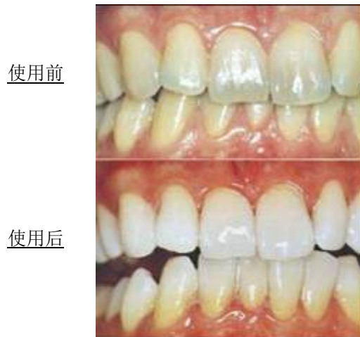
图二、牙齿美白凝胶使用前后牙齿颜色的差异