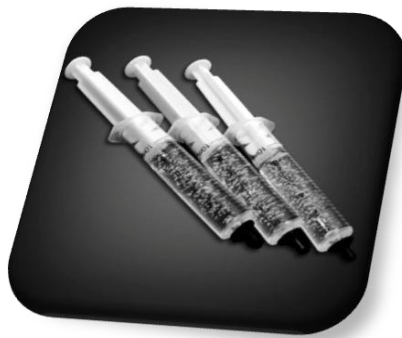
圖一、牙齒美白凝膠

隨著經濟富裕，國人對於外表美觀的要求日益提升，對於牙齒外觀的潔白也越來越重視。牙齒變色的主要原因包括不良的口腔衛生、食用含有色素的食物和飲料以及抽煙等。遠東開發的美白凝膠產品(圖一)以專業的配方設計，藉由特殊美白成份與有機色素分子進行氧化還原作用，進而破壞含雙鍵碳環的色素分子結構，使其成為單鍵的有機分子，進而達到牙齒美白的功效(圖二)。經實驗證實美白凝膠搭配波長 400nm ~ 500nm 藍光照射牙齒二十分鐘後，可使經過染色的牙齒有明顯顏色淡化的趨勢(圖三)，具有極佳的牙齒美白功效。